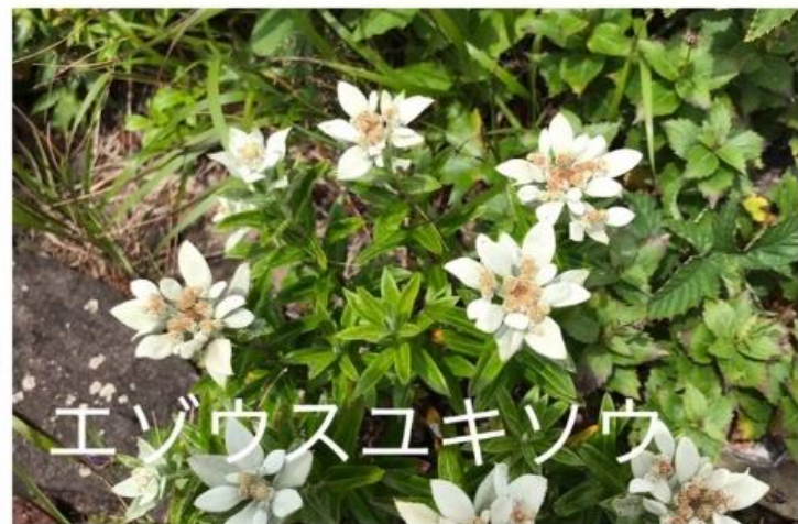
エゾウスユキソウ