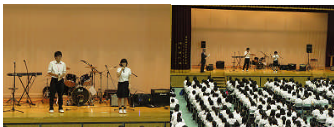
(実行委員長・会長挨拶) (三桜祭の紙飛行機)