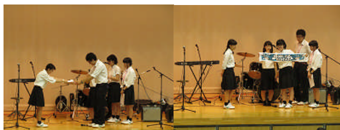
(テーマ・ポスター・タオルデザインの表彰)